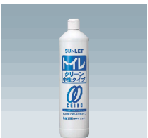
中性トイレクリーン