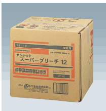
20kgタイプ (キュービテナー)