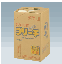
18kgタイプ (タフテナー)