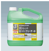
スーパーブリーチ・6

食品添加物の商品も各種取り揃えております。 次亜塩素酸ナトリウム 6% (上記写真) ・ 1.2% 以上